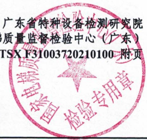
限速器产品适用参数范围和配置表