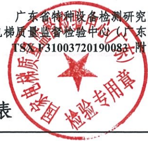
限速器产品适用参数范围和配置表