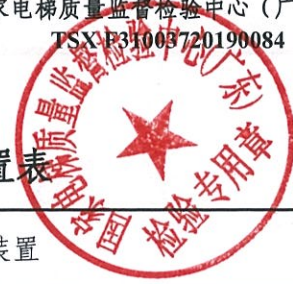
限速器产品适用参数范围和配置表